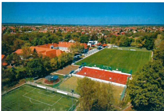
A sport telep

Jelenleg a felnőtt csapat a megyei I. osztályban szerepel.