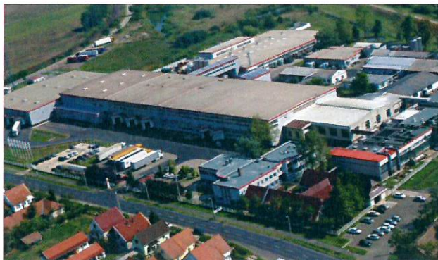
A Henkel gyár